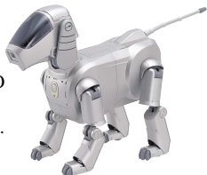
(The ERS-110 is shown in the photo.)

With AIBO Life, your adolescent or adult AIBO ERS-210 can enjoy chatting with a first-generation AIBO ERS-110/111 using the special AIBO tone language. In this way, even AIBOs of different generations can become good friends.